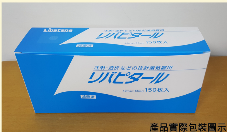
產品實際包裝圖示